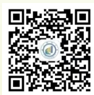
“励志川师” 微信公众号