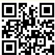
四川省学生资助 管理中心网站